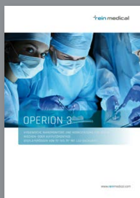
N° comm. BR-DE-OP3