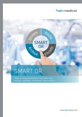
N° comm. BR-DE-SOR

Sur demande, nous vous envoyons gratuitement nos brochures. Envoyez-nous simplement un e-mail en indiquant la ou les brochures que vous souhaitez à : info@reinmedical.com . Vous trouverez en outre tous les brochures au format PDF à télécharger sur : www.reinmedical.com