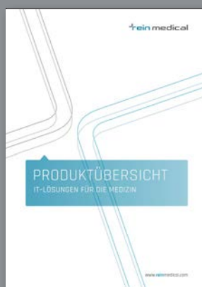
N° comm. BR-ES-PRK

Rein Medical vous fournit de nombreuses informations. Qu'il s'agisse de produits individuels ou de projets d'intégration complexes : vous trouverez d'un coup d'œil les caractéristiques importantes, les avantages et les exemples d'application dans nos brochures.